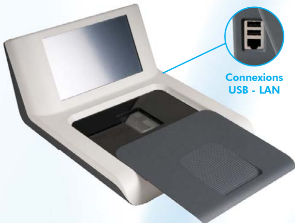
Connexions USB - LAN