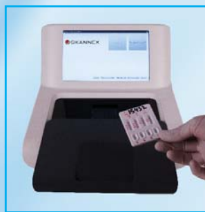
2- Déposer la cassette.