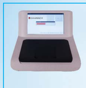
6- Attendre 15 secondes.