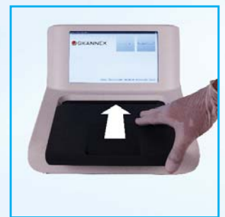
4- Fermer le couvercle..