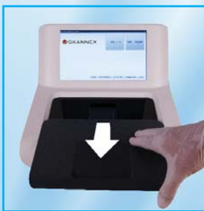
1- Ouvrir le couvercle