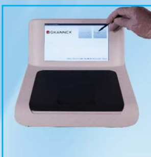
5- Procéder à la lecture