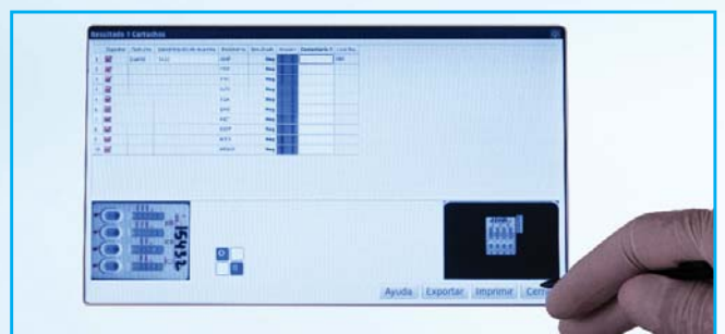
7- Voir les résultats, identifier l'échantillon patient et le lot réactif, ajouter des commentaires, envoyer on-line...