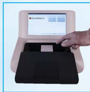
3- Déposer test..